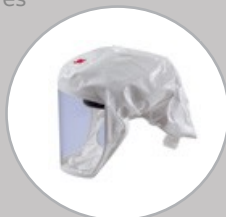
Coiffe S133L CLBS133L