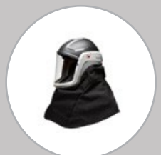
Cagoule M-406 CSM406