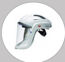
Pare-visage M-10 PVM106