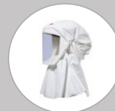
Cagoule S-533L CLBS533L