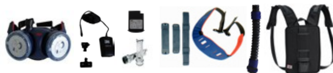
modèle avec ceinture + harnais